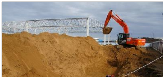
Управление строительными проектами